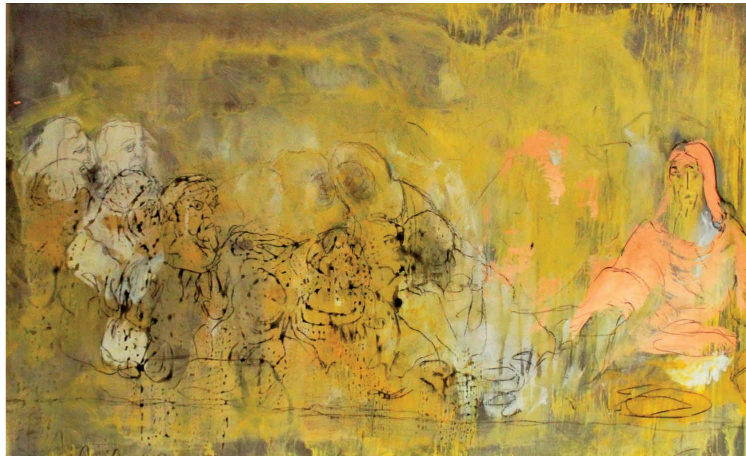
Poslední večere 2019, olej na transparentním plátně, 61 x 91 cm