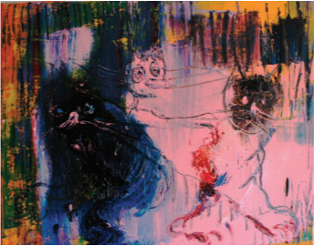
Kočky za plotem 2018, olej na plátně, 45 x 50 cm