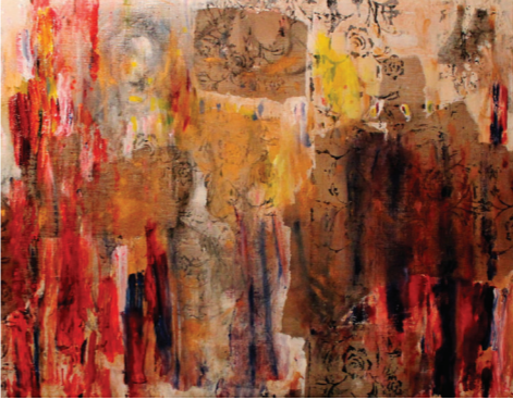
Modlitba 2019, olej na plátně, 78 x 96 cm