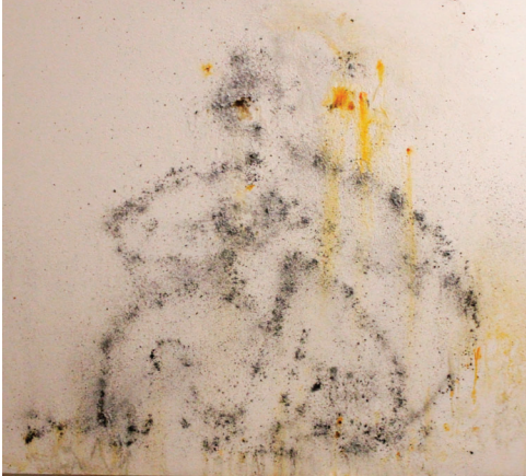
Stíny Augusta Rodina 2019, malba na plátně s cigaretovým popelem, 77 x 96 cm