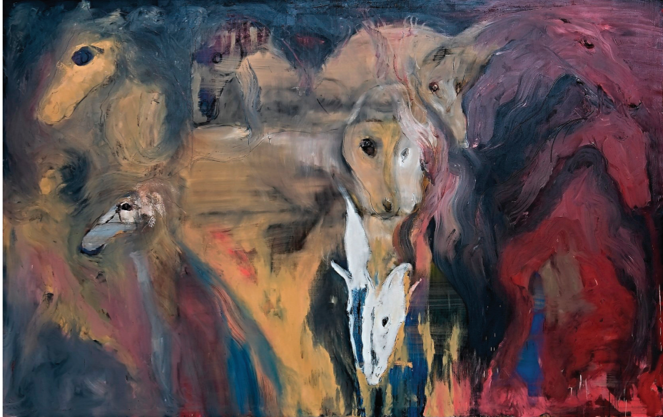
Divocí koně v krajině 2018, olej na plátně, 258 x 359 cm

vůni, malby s ženami záhadnými a proměnlivými.“