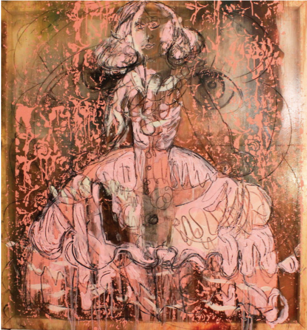
Infantka Margarita 2019, olej, akryl na plátně a transparentním plátně, 110 x 100 cm