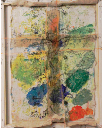
Ukřížování 2019, olej, akryl na plátně a transparentním plátně, 40 x 30 cm